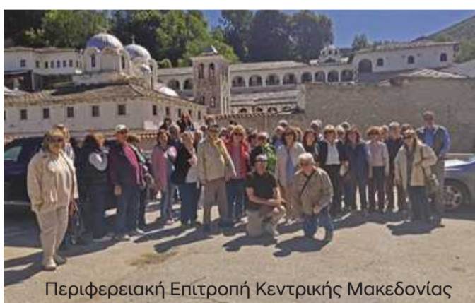
Περιφερειακή Επιτροπή Κεντρικής Μακεδονίας

Στις 6 Ιουνίου 2026 πραγματοποιήθηκε η ετήσια συνεστιάση στο Αγρίνιο, η οποία είχε αναβληθεί λόγω του θανάτου του συναδέλφου και προέδρου της