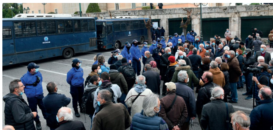
Τα ΜΑΤ έφραξαν το δρόμο στους συνταξιούχους «ταραξίες»

Βρισκόμαστε αντιμέτωποι με ένα «τσουνάμι» ακρίβειας στην ενέργεια και σε βασικά αγαθά, που μας έχει γονατίσει οικονομικά. Ο πληθωρισμός ήδη «καλπάζει (4,8 %) και κανένα από τα μέτρα «ασπιρίνες» της κυβέρνησης, δεν μπορεί να αναχαιτίσει το «φαινόμενο».