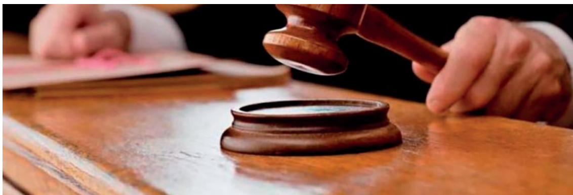
Ζητάμε επίμονα από την κυβέρνηση, να χορηγήσει σ' όλους τους συνταξιούχους, τα υπολειπόμενα αναδρομικά των δώρων και του επικουρικού

Μια νέα απόφαση-πιλότος για όσες ακολουθούν, δικαιώνει