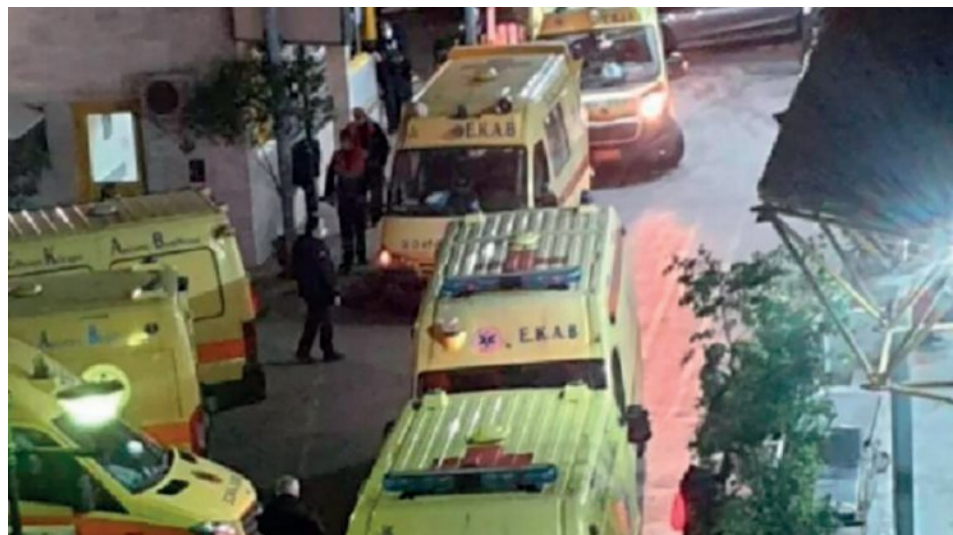
Η κυβέρνηση συνεχίζει τον εμπαιγμό με τη δήθεν θωράκιση του Ε.Σ.Υ

Αντί, λοιπόν, να αλλάξει τακτική, να κάνει αυτοκριτική και να διορθώσει τις κακοτοπιές, ενισχύοντας το Ε.Σ.Υ, η κυβέρνηση εξακολουθεί να μετακυλίει την πολιτική της ευθύνη στους πολίτες και στην «ατομική ευθύνη» τους, Το γεγονός ότι οι ίδιοι οι κυβερνώντες αποτελούν το κακό παράδειγμα , θυμίζουμε τη βόλτα του πρωθυπουργού στην Πάρνηθα, το γεύμα στην Ικαρία, την Τσικνοπέμπτη στον ΕΟΔΥ και τη πρόσφατη βύρση στην οποία συμμετείχε ο Αδωνις Γεωργιάδης, ενισχύει τη δυσπιστία του κόσμου απέναντι στα περιοριστικά που η ίδια επιβάλλει. Η δυσaráσκεια των πολιτών για τους