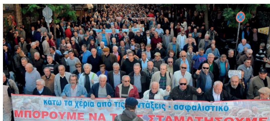
Δεν θα επιτρέψουμε να γίνουν οι επικουρικές μας συντάξεις, βορά στα χέρια των ιδιωτών

Ή μήπως, η κυβέρνηση εντέχνως άφησε το πρόβλημα των εκκρεμών συντάξεων να γιγαντωθεί, προκειμένου να αποκτήσει την κατάλληλη δικαιολογία για την είσοδο ιδιωτών στο ασφαλιστικό σύστημα; Διότι η συγκεκριμένη κυ-