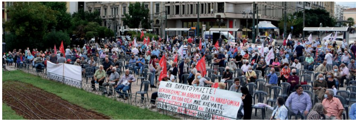
Το Συλλαλητήριο της ΣΕΑ πραγματοποιήθηκε πριν την επιβολή του δεύτερου lockdown

Δεν θα έμεναν αδρανείς για τις συνθήκες που επικρατούν στα σχολεία με τα παιδιά και