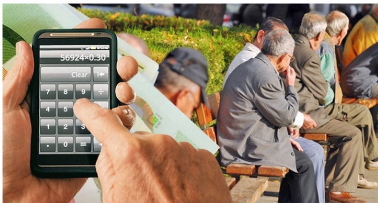
Ζητάμε από την κυβέρνηση να εκδώσει αποφάσεις για τον επανυπολογισμό

ποσά των επανυπολογιζόμενων συντάξεων είναι ελλιπή, δηλαδή είναι πολύ κάτω από τα προβλεπόμενα του νέου νόμου 4387/2016.