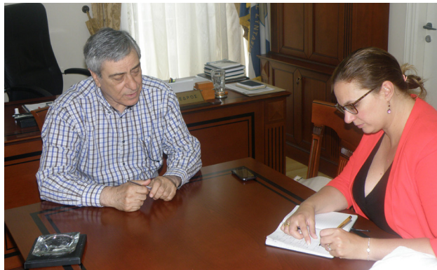
Κορυφαία διεθνή ΜΜΕ όπως η Le Monde και το BBC, αναγνώρισαν το έργο και τον ρόλο του Συλλόγου μας

Προτεραιότητά μας είναι ο οβολός των συναδέλφων να επιστρέφει στους συναδέλφους, μέσω και της συμμετοχής τους σε διάφορες εκδηλώσεις. Όχι,