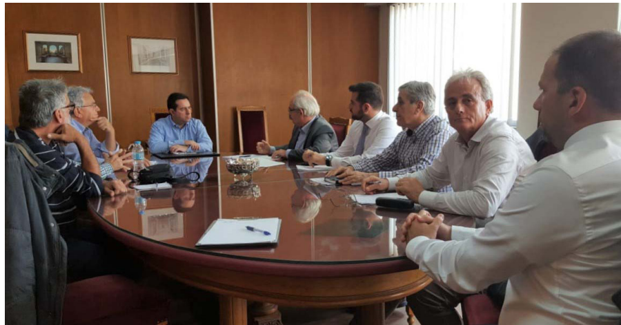
Στιγμιότυπο από τη συνάντηση με τον υφυπουργό Εργασίας Νότη Μηταράκη

με τις τελεσίδικες αποφάσεις της δικαιοσύνης και θα τις εφαρμόσουμε στο ακέραιο, διασφαλίζοντας παράλληλα και τη δημοσιονομική σταθερότητα της χώρας».