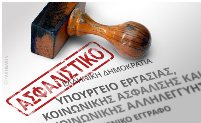
Η Διοίκηση του Συλλόγου κατέθεσε τις θέσεις και τις προτάσεις της για την κοινωνική ασφάλιση

Αυτοί που ανήκουν στην παραπάνω κατηγορία είναι πολλοί συνταξιούχοι, ο συντελεστής ανταποδοτικότητας γι' αυτές τις περιπτώσεις είναι πολύ μικρός και ως εκ τούτου