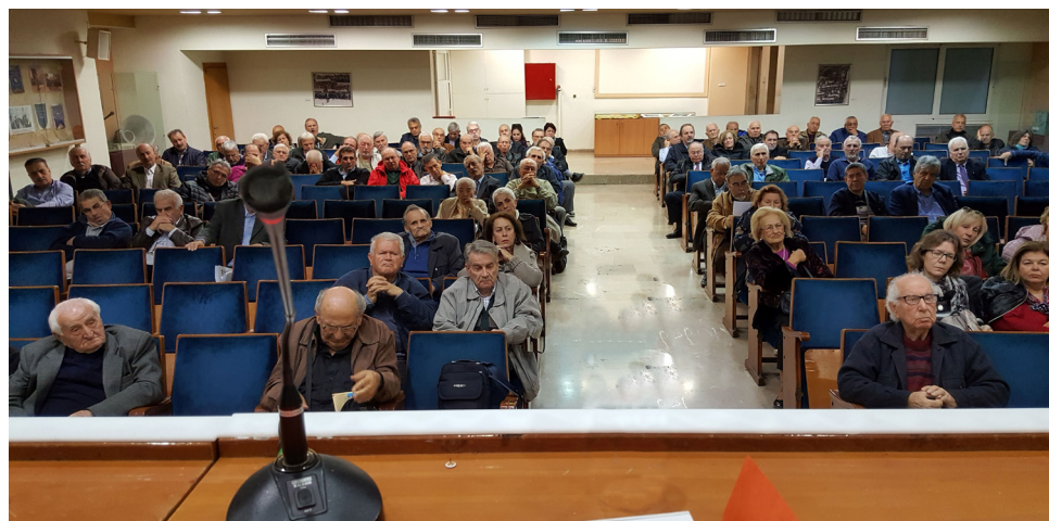
Οι συνάδελφοι της Κεντρικής Μακεδονίας ενημερώθηκαν για όλα τα «φλέγοντα» ζητήματα που απασχολούν τους συνταξιούχους

Κατόπιν ο πρόεδρος αναφέρθηκε διεξοδικά στα θέματα των συνταξιούχων μελών του του Συλλόγου. Ειδικότερα τόνισε: «Ως Διοίκηση λειτουργήσαμε για πολλά χρόνια στην καρδιά της κρίσης, η οποία ακόμα υπάρχει. Συναντήσαμε όλους τους υπουργούς, και τους προηγούμενους πρωθυπουργούς, Σαμαρά