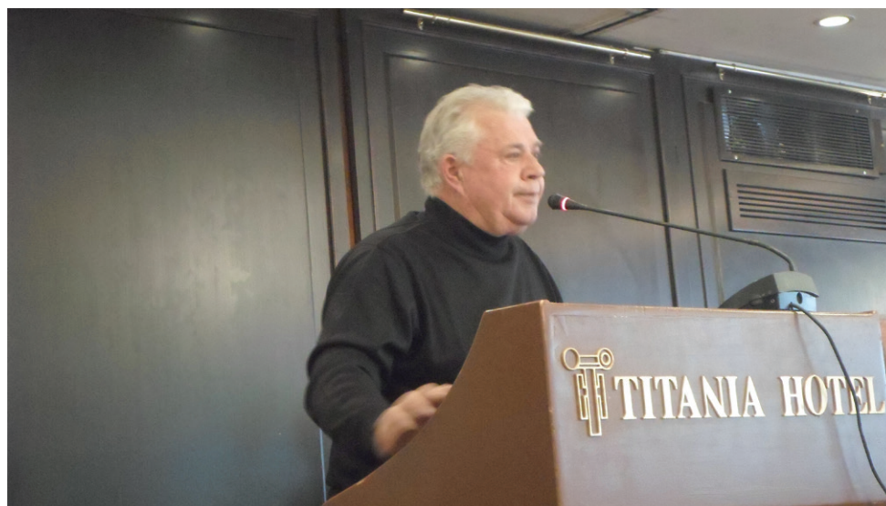
Η δουλειά μας είναι το συμφέρον των συνταξιούχων

Η δουλειά μας είναι να μην ξεχνάμε ποιοι