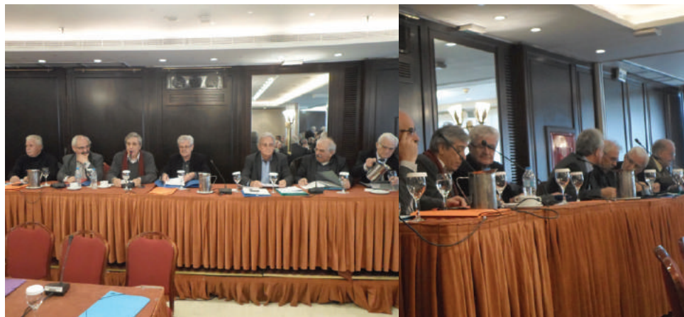
Τα μέλη του Διοικητικού Συμβουλίου κατά την έναρξη των εργασιών της Γενικής Συνέλευσης

Πρόεδρος: Είμαστε στη λήξη αυτής της θητείας. Είχαμε την ευθύνη του Συλλόγου. Εμείς, σ' αυτή εδώ τη συνέλευση, δεν αισθανόμαστε την ανάγκη να απολογηθούμε, αλλά να συνεννοηθούμε μ' εσάς. Μας αγκαλιάσατε, εδώ και τέσσερα χρόνια. Χτίσαμε μια ενότητα, στη βάση των συναδέλφων. Δεν κοιτάξαμε το κομματικό μας συμφέρον , αλλά να αναδείξουμε τα προβλήματα, μέσα από μία κοινή γραμμή. Δεν είναι ώρα για ρίξουμε νερό στο μύλο κανενός κόμματος. Με βάση αυτή τη λογική, ξεκινήσαμε αυτόν τον αγώνα, αναδείξαμε τα ζητήματα.