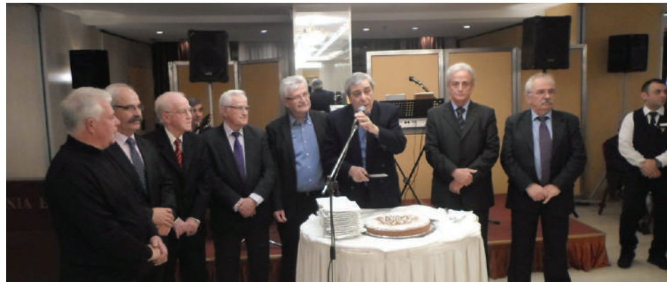
Σύσσωμο το Διοικητικό Συμβούλιο του Συλλόγου, κατά την κοπή πίτας

«Συνάδελφοι και συναδέλφισσες καλησπέρα, εύχομαι μια καλύτερη χρονιά σ' εσάς και την οικογένειά σας. Ανήκουμε στην κοινωνική ομάδα που ένιωσε περισσότερο