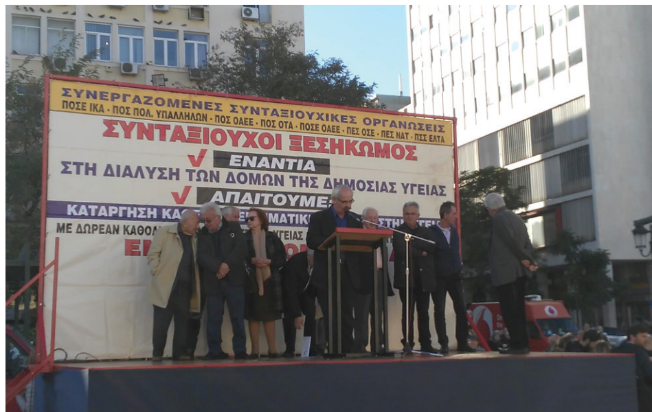
Φωτό από την ομιλία κατά την Παναττική Συγκέντρωση για την Υγεία

Η υγεία, αποτελεί κρίσιμο δείκτη ανάπτυξης της χώρας. Αδύναμες και ευπαθείς ομάδες, όπως εμείς οι συνταξιούχοι,