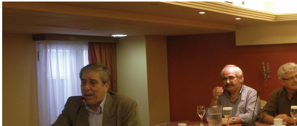
Κλιμάκιο της Διοίκησης ενημέρωσε τους συναδέλφους της επαρχίας

Η Διοίκηση αποφάσισε να ιδρύσει την Περιφερειακή Επιτροπή Ανατολικής Μακεδονίας με έδρα την Καβάλα και αυτό