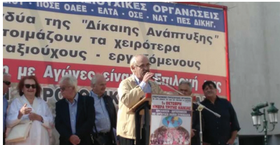
Φωτό από την ομιλία κατά τη Παναθηναϊκή Συγκέντρωση, στις 4/10/2017

Οι ψηφισμένες ήδη μειώσεις στις συντάξεις μας για το 2019 και η μείωση του