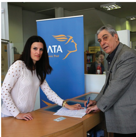
Ο πρόεδρος και ο γραμματέας του Συλλόγου, υπογράφουν τη σύμβαση

Υ.Γ: Για τα τεχνικά ζητήματα που είναι απαραίτητα για την υλοποίηση της συμφωνίας, που προβλέπει την ένταξη και των συνταξιούχων στο εκπαιδευτικό πρόγραμμα «Ερμής», που είναι ενταγμένοι οι εργαζόμενοι, κάνουμε ήδη ενέργειες και θα ενημερωθείτε σύντομα.