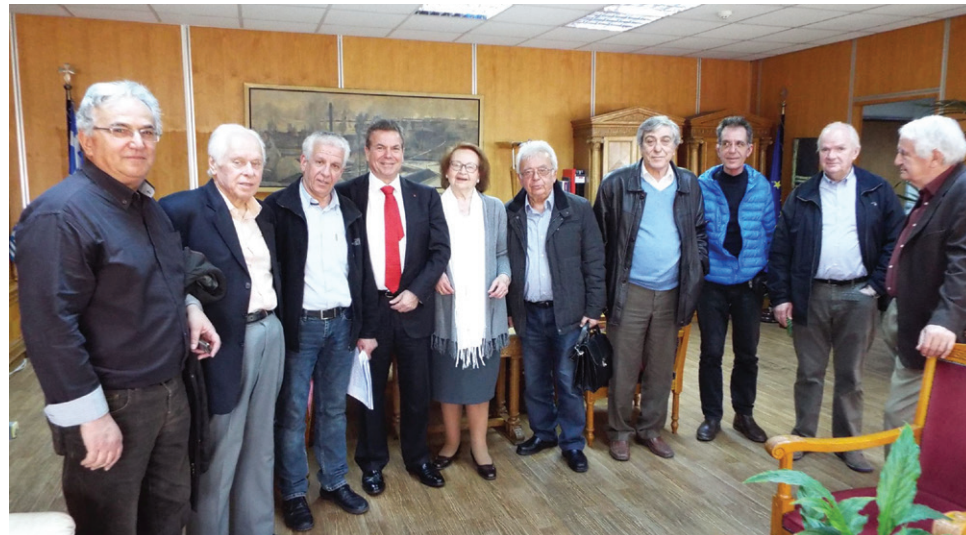
Στιγμιότυπο από τη συνάντηση με τον υφυπουργό Εργασίας, Αναστάσιο Πετρόπουλο

Το «βοήθημα για όλους τους συνταξιούχους» αποτελεί κεντρικό αίτημα του Συλλόγου μας αλλά και της ΣΕΑ, το οποίο έχει διαμνηυθεί και στον ίδιο τον