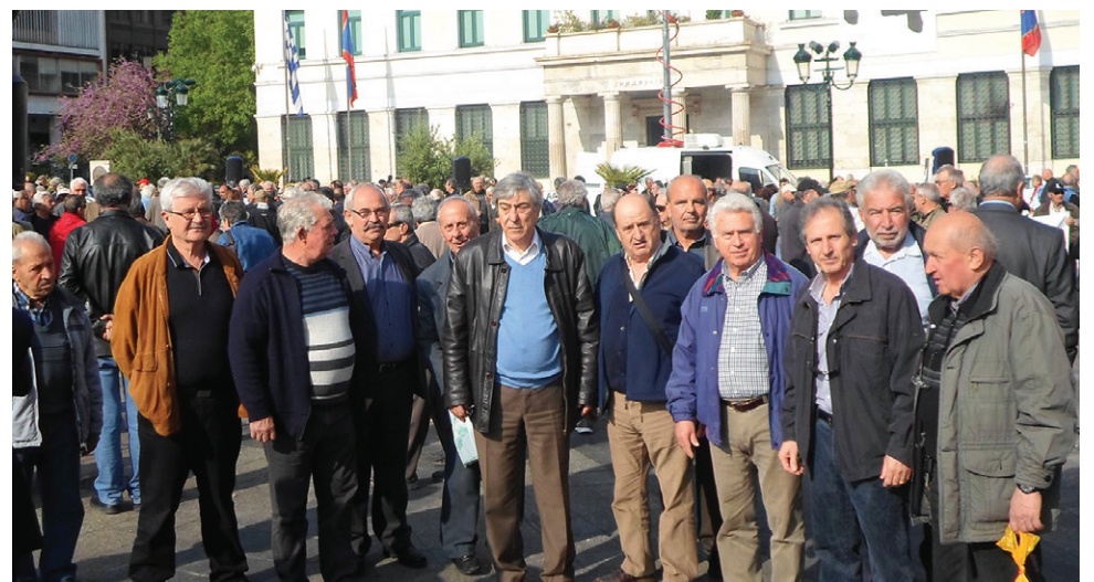
Αντιπροσωπεία της διοίκησης και συνάδελφοι, παραβρέθηκαν στην συγκέντρωση της ΣΕΑ

Τον Σύλλογό μας εκπροσώπησε αντιπροσωπεία του Διοικητικού Συμβουλίου, καθώς και πλήθος συναδέλφων.