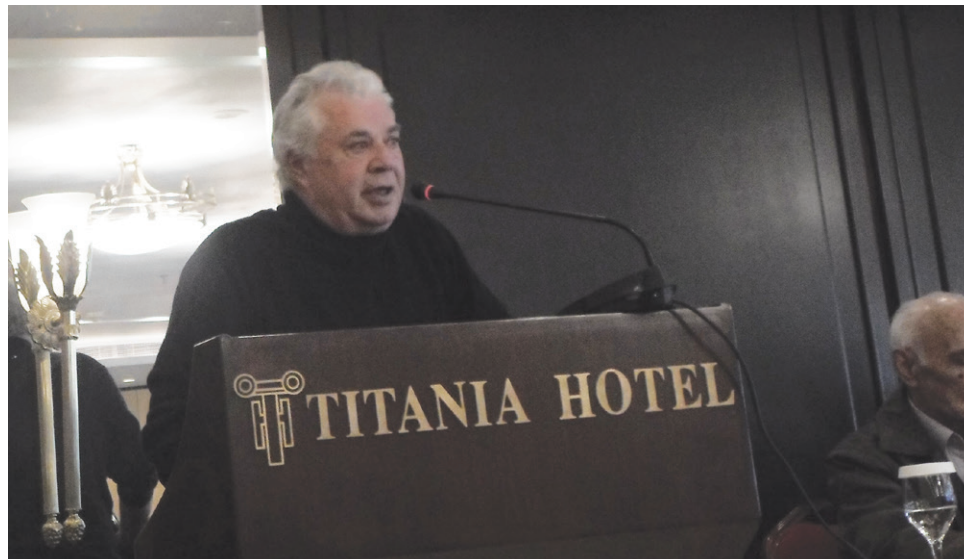
Ταμίας Η.Κουτρούλης: Ο οβολός των συναδέλφων θα επανέρχεται σ αυτούς

Ποιας όμως πολιτικής ηγεσίας; Εδώ λοιπόν είναι η ευθύνη ημών των πολιτών της, να της δώσουμε την πολιτική ηγεσία που θέλει και μπορεί να φέρει την χώρα και τον λαό της στην θέση που της αξίζει και στην οποία ανήκει.