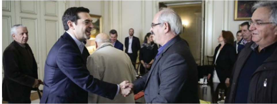
Χειραψία του γενικού γραμματέα Γιώργου Πεπόνη, με τον πρωθυπουργό Αλέξη Τσίπρα

Η αντιπροσωπεία είχε μια εποικοδομητική συζήτηση με τον κ.Τσίπρα, ο οποίος δεσμεύτηκε ότι η κυβέρνηση δεν θα προχωρήσει σε νέες περικοπές στις συντάξεις.