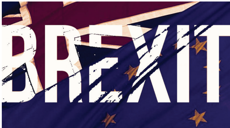
Οι Βρετανοί με την ψήφο τους στο Brexit, αποδοκίμασαν τις πολιτικές λιτότητας που εφαρμόζονται στην ΕΕ

αγγλικού βορά, η διάλυση του κρατικού συστήματος Υγείας και οι σημαντικές περικοπές στις κοινωνικές παροχές, η αυξημένη ανεργία, η εξόντωση των εργατικών συνδικάτων και η φοροληστρική πολιτική, συνέθεσαν το παζλ της θάτσερικής διακυβέρνησης, που άφησε ανεξίτηλα τα σημάδια στη Βρετανία αλλά και στην Ευρώπη.