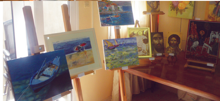
Έργα των συναδέλφων συνταξιούχων