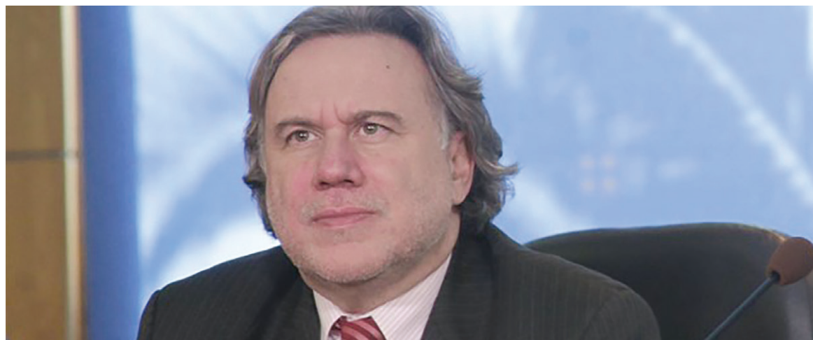
Ο υπουργός Εργασίας έγινε αποδέκτης δύο επιστολών που εστάλησαν από την Διοίκηση του Συλλόγου

Έτσι, συνταξιούχος που χωρίς την επικουρική υπαγόταν σε μικρότερο ποσοστό κρατήσεων, τώρα με την επικουρική θα υπαχθεί στο μεγαλύτερο ποσοστό για ολόκληρη τη σύνταξή του,