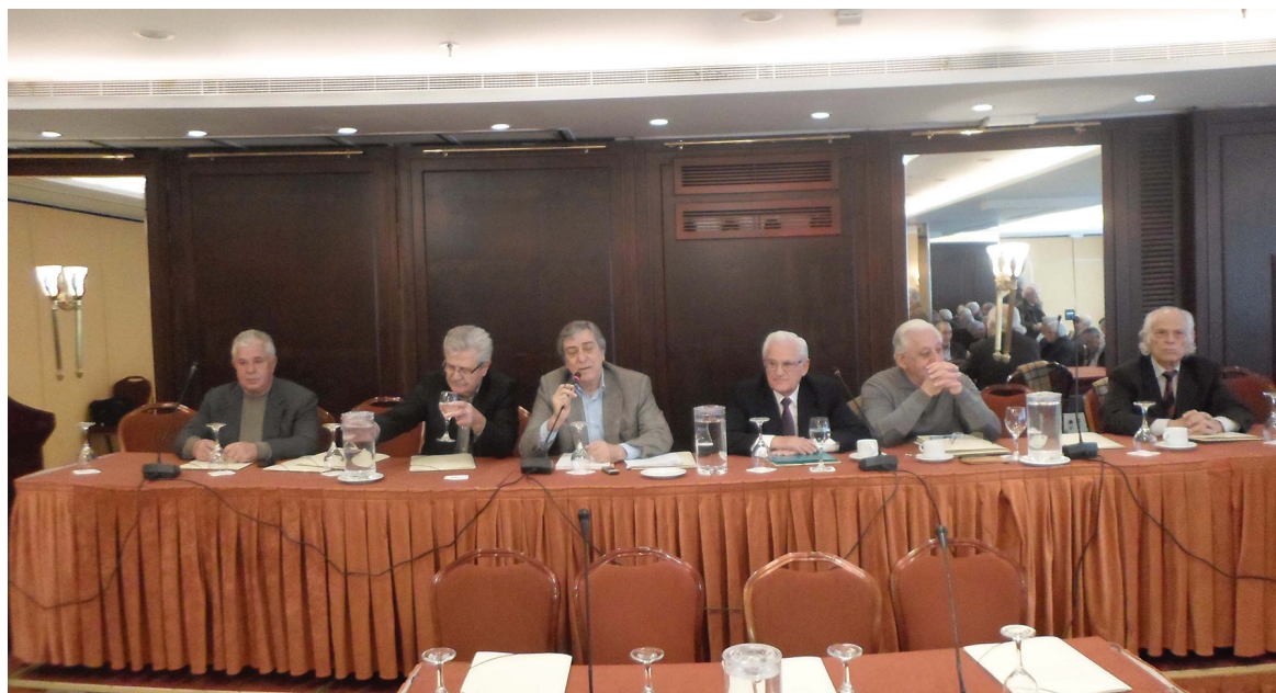
Το Διοικητικό Συμβούλιο του Συλλόγου μας κατά την έναρξη της Γενικής Συνέλευσης

Ο Σύλλογος μας ως μέλος της ΣΕΑ (Συντονιστική Επιτροπή