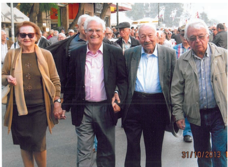
Στην πρώτη γραμμή των αγώνων οι Πρόεδροι των Συνταξιοδικών Οργανώσεων δίνουν πάντα το αγωνιστικό τους παρόν

Όμως ο αγώνας μας και γι' αυτό το θέμα δεν τελειώνει εδώ. Θα συνεχίσουμε!