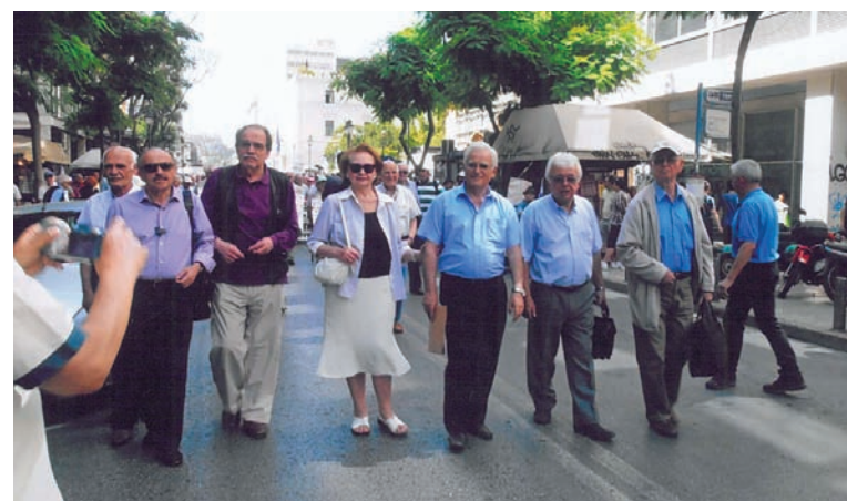
Πορεία διαμαρτυρίας στις 31/10/2013 για την περίθαλψη

5. Την καθιέρωση ενιαίου (ενός) αριθμού μητρώου για τον κλάδο Σύνταξης, του κλάδου υγείας και περίθαλψης με την ταυτόχρονη κατάργηση των συναρμοδιοτήτων και τη βελτίωση της ποιότητας των προσφερομένων υπηρεσιών του κοινωνικοασφαλιστικού συστήματος της χώρας, που είναι το ζητούμενο και ο εξυγιαντικός στόχος.