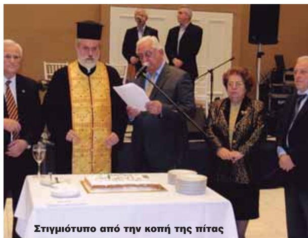
Στιγμιότυπο από την κοπή της πίτας

Σας καλωσορίζουμε στην αποψινή γιορτή του Συλλόγου μας για την πίτα του νέου χρόνου.