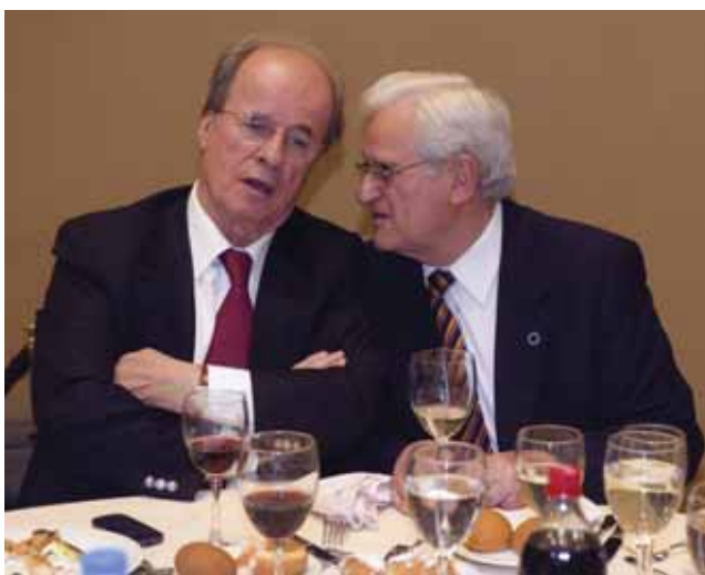
Ο τ. Υπουργός κ. Α. Φούσας με τον κ. Ζώη

Αυτό το τοιμήσαμε, γιατί η περιφέρεια έχει τα πολλαπλά προβλήματα. Αγώνας και προσπάθεια τώρα είναι το πρόγραμμά μας και ο ενωτικός αγώνας εργαζομένων και συνταξιούχων, μηνύματα που δόθηκαν από τους συναδέλφους με ψήφισμα στην