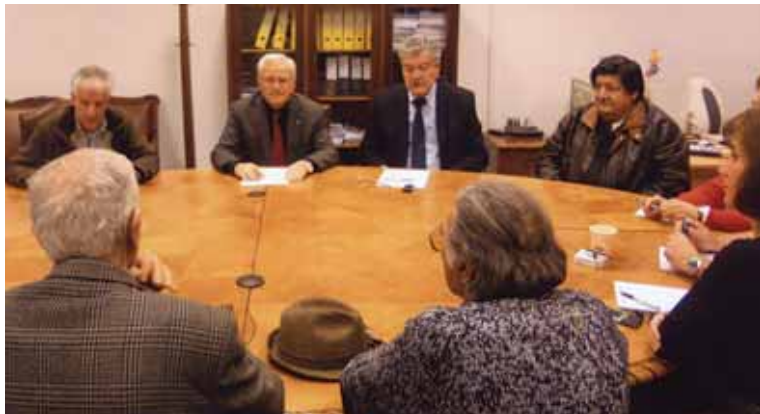
Στιγμιότυπο από τη σύσκεψη των Προέδρων της ΣΕΑ με τον Πρόεδρο του ΕΟΠΥΥ κ. Παπαγεωργόπουλο

Για τα θέματα υγείας Συνάντηση του κ. Ι. Ζών με τον Πρόεδρο του ΕΟΠΥΥ στις 7.3.2012