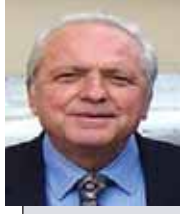
Επιμέλεια: ΧΡΗΣΤΟΥ ΚΟΝΤΟΥ Αντιπροέδρου Δ.Σ.

Στο νέο κανονισμό του ΕΟΠΥΥ [Υπουργική απόφαση ΕΜΠ5/ΦΕΚ 3054/Β 18.11.2012] καθορίζονται οι παροχές που δικαιούνται οι ασθενείς ασφαλισμένοι ως παρακάτω: