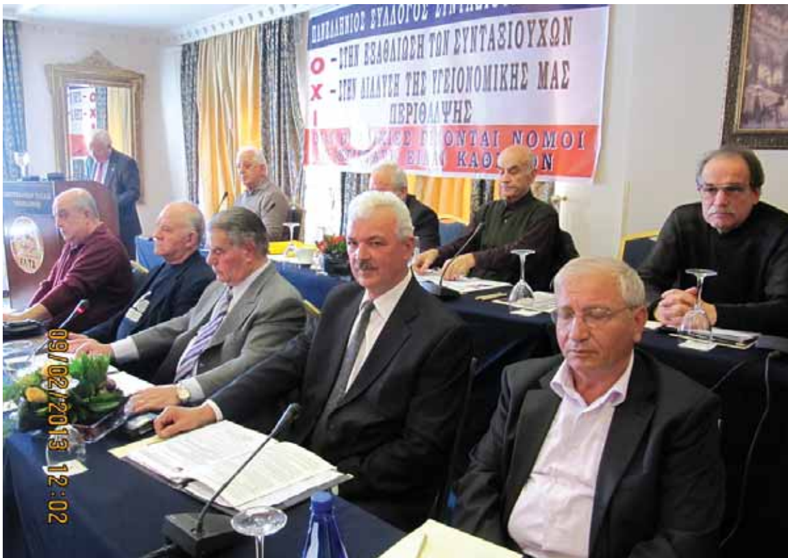
Η δυναμική παρουσία στη φετινή Γ.Σ. των Εκπροσώπων των Τοπικών Περιφερειών Μακεδονίας-Θράκης, Ηπείρου, Πελοποννήσου και Θεσσαλίας έδωσε το στίγμα της ανάπτυξης του αγώνα για τα προβλήματα μας σε όλη τη χώρα

3-10% ακολουθεί, σύμφωνα με τις διατάξεις της παραγρ. του άρθρου 2 του Ν. 4024/11 από 1-1-2011 και εφεξής νέα μείωση.