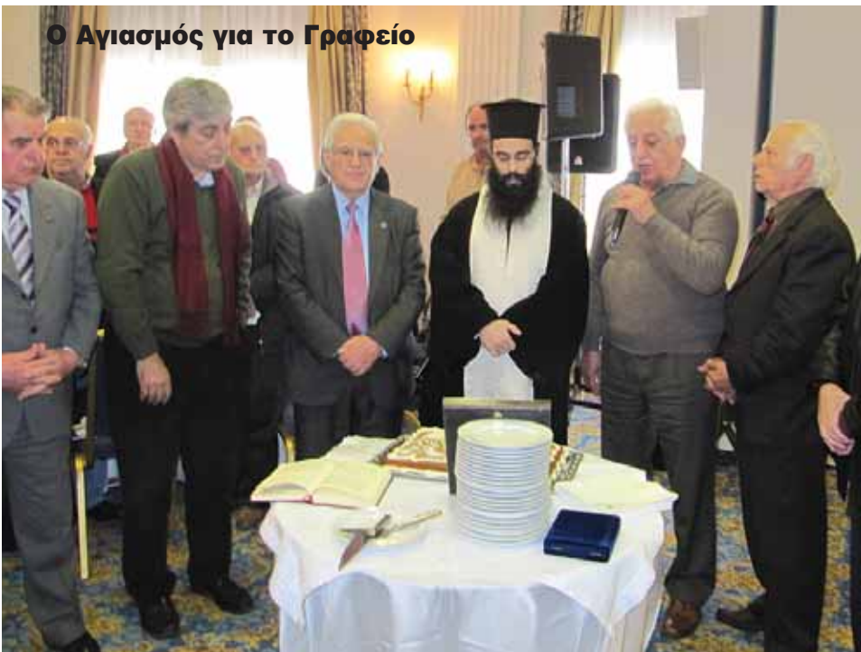
Ο Αγιασμός για το Γραφείο