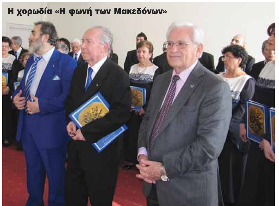
Η χορωδία «Η φωνή των Μακεδόνων»

Στις 10/2/2013 παρουσία των Μελών της Επιτροπής Μακεδονίας-Θράκης, του Προέδρου και Μελών του Δ.Σ και πολλών Συναδέλφων έγιναν τα Εγκαίνια του αποκτηθέντος Γραφείου του Συλλόγου μας στη Θεσσαλονίκη για την στέγαση της εκεί Περιφερειακής Επιτροπής. Τελέστηκε Αγιασμός και τοποθετήθηκε στο Γραφείο Εικόνα της Παναγίας, Δώρο των Συναδέλφων Συνταξιούχων του ΟΤΕ.