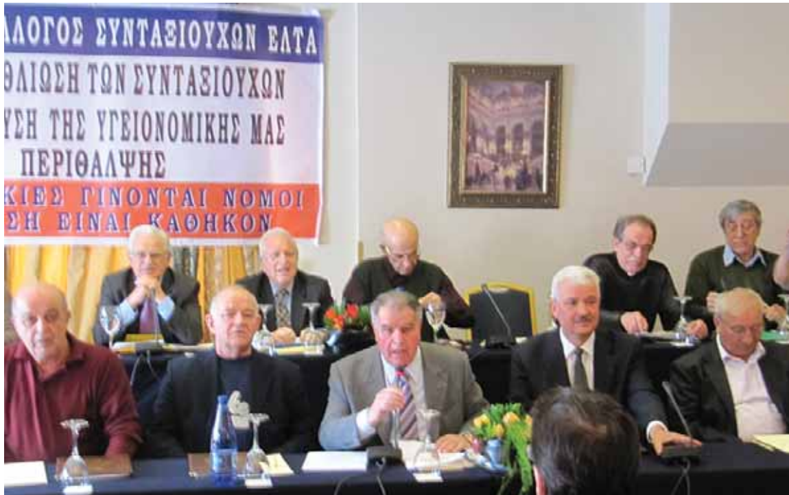
Από τη Γενική μας Συνέλευση. Στην κάτω σειρά ο Προεδρείο της Γ.Σ. από τους συναδέλφους εκπροσώπους των Τοπικών Περιφερειακών Επιτροπών και στη δεύτερη σειρά ο Πρόεδρος και Μέλη του Δ.Σ. του Συλλόγου μας

Οδηγούμαστε μεθοδικά και με μαθηματική ακρίβεια στην πλήρη εξαθλίωση. Οι συνθήκες που καλούμαστε να αντιμετωπίσουμε στην καθημερινότητά μας ως Συνταξιούχοι, συγκρίνονται μόνο με τριτοκοσμικές χώρες ή χώρες που καταστρέφονται από πόλεμο, Κατα συνέπεια, η ζωή μας τίθεται στο περιθώριο και απειλείται από τη σχεδόν ολοκληρωτική αδυνα-