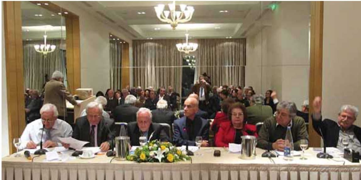
Ο Πρόεδρος και Μέλη του Σηλλόγου μας κατά τη διάρκεια της Αγωνιστικής Εκδήλωσης στο Ηράκλειο Κρήτης

λιτική όλων των Κυβερνήσεων τα τελευταία χρόνια είναι γνωστά σε όλους.