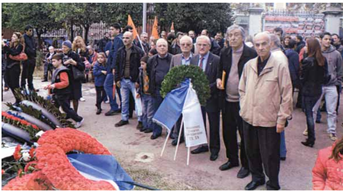
Ο Πρόεδρος και τα Μέλη του Δ.Σ. ενώ καταθέτουν στεφάνι και φέτος στο Πολυτεχνείο, τιμώντας την αντίσταση των Ελλήνων κατά της δικτατορίας