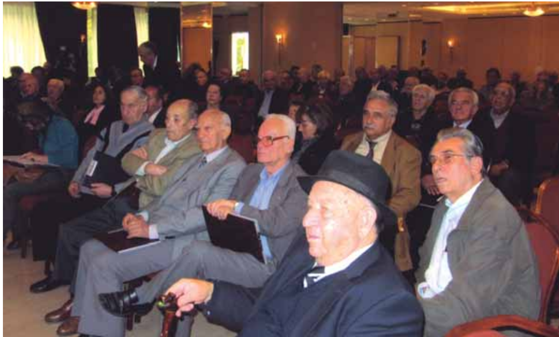
Οι Συνάδελφοι παρακολουθούν τις εργασίες της Καταστατικής Συνέλευσης

Τα μέλη του Συλλόγου με την προϋπόθεση της εκπλήρωσης των οικονομικών τους υποχρεώσεων, έχουν όλα τα δικαιώματα που προβλέπονται από τους νόμους και το Καταστατικό.