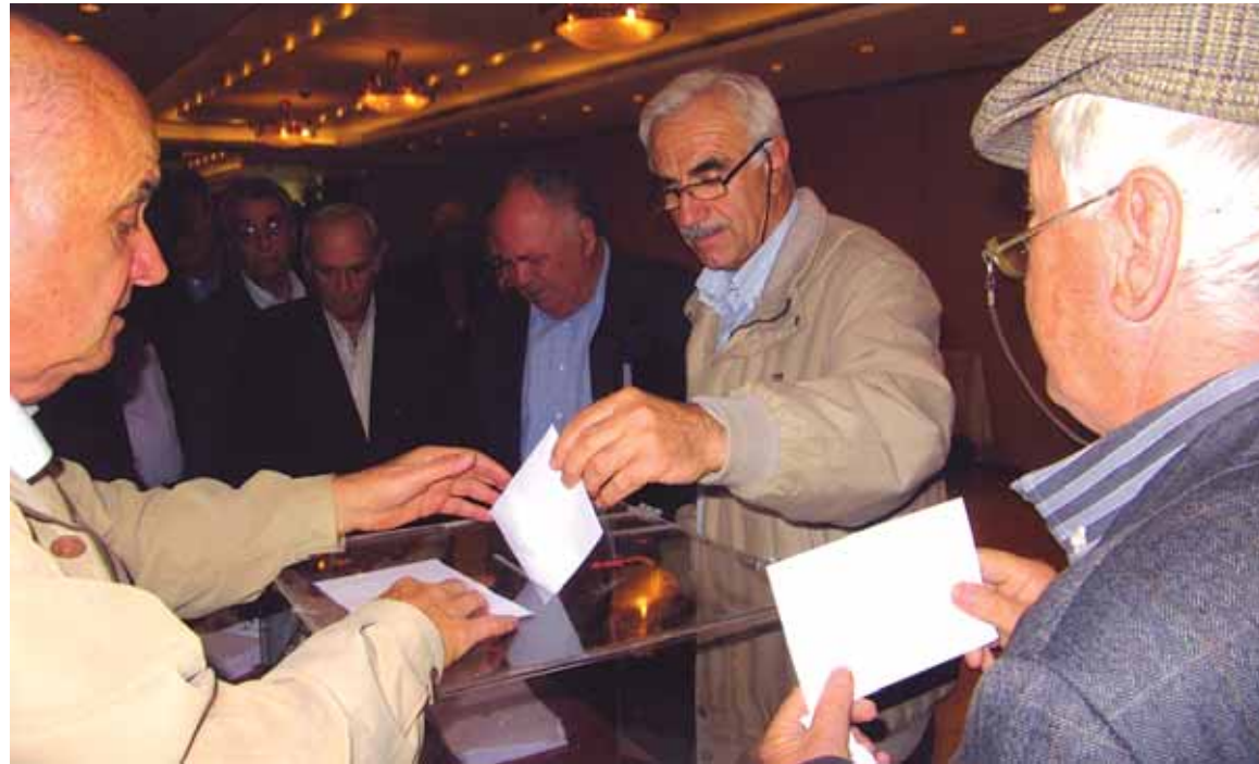
Στιγμιότυπο από την ψηφοφορία για την έγκριση του Καταστατικού

Συνεδριάζει τακτικά μια φορά τον μήνα και έκτακτα κάθε φορά που υπάρχει ανάγκη. Οι αποφάσεις του λαμβάνονται με πλειοψηφία των παρόντων μελών και έχουν κύρος αν στη συνεδρίαση