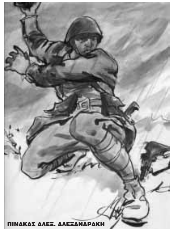
ΠΙΝΑΚΑΣ ΑΛΕΞ. ΑΛΕΞΑΝΔΡΑΚΗ

Η πλειονότης των ιστορικών αναγνωρίζει, ότι στα ιστορικά χρονικά δεν υπάρχει παράδειγμα καθολικής αντίστασης κατά του κατακτητή, όπως αυτή του ελληνικού λαού κατά τη διάρκεια του Β' Παγκόσμιου πολέμου, από της ενάρξεως των εχθροπραξιών στις 28 Οκτωβρίου 1940 μέχρι την απελευθέρωση τον Οκτώβριο του 1944. Ένας λαός, με πενιχρά υλικά μέσα, μπόρεσε με το ατσάλι της ψυχής του, να νικήσει και να μην καθυποταχθεί από τις σιδηρόφρακτες δυνάμεις της εποχής, του Ναζισμού και Φασισμού.