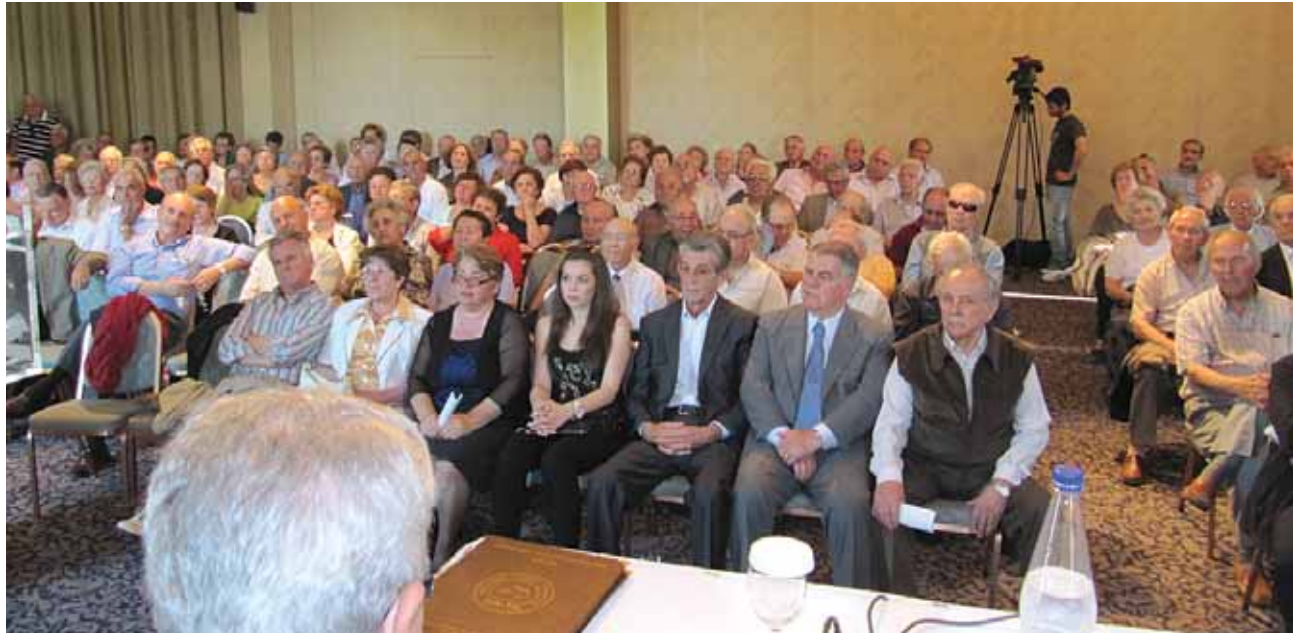
Οι συνάδελφοι της Βορείου Ελλάδος παρακολουθούν τις εργασίες ενημέρωσης για τις Τοπικές Επιτροπές

Με αυτές τις σκέψεις κλείνω το χαιρετισμό μου και σας ευχαριστώ που με ακούσατε.