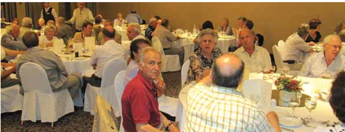
Στιγμιότυπο από τη Συνεστίαση των συναδέλφων στο «Μακεδονία Παλλιάς»

Στο κέντρο της Αθήνας συγκεντρώθηκαν και πολίτες από άλλες πόλεις της χώρας, όπως από το Ηράκλειο, το Ρέθυμνο, αλλά και από το εξωτερικό. Αναμένεται δε η μεγάλη συγκέντρωση στη Θεσσαλονίκη του Μίκη Θεοδωράκη.