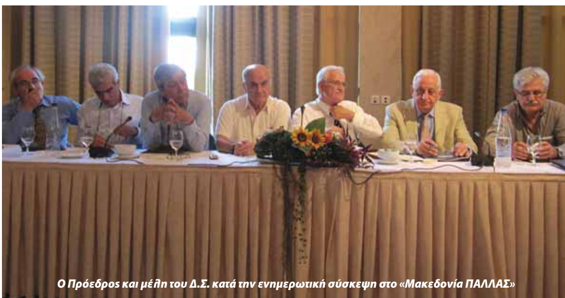
Ο Πρόεδρος και μέλη του Δ.Σ. κατά την ενημερωτική σύσκεψη στο «Μακεδονία ΠΑΛΛΑΣ»

Με πύρινη γλώσσα μίλησαν οι συνάδελφοι προσκεκλημένοι προς τον πρόεδρο και τα παρόντα μέλη του Δ.Σ., για τη μακρόχρονη εγκατάλειψη της επαρχίας από το