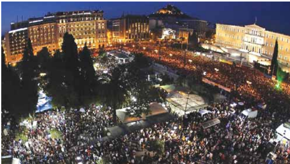
Πλατεία Συντάγματος 28-29 Μαΐου. Λένε ότι μία (1) φωτογραφία, χίλιες λέξεις...! Πάνω από 100.000 κόσμος ήταν στην Πλατεία!! Η Διοίκηση του Συλλόγου, πού ήταν; Απάντηση: Στο εστιατόριο του ξενοδοχείου «ΜΑΚΕΔΟΝΙΑ»...!

Η ανακοίνωση δεν παραλείπει να αναφερθεί και στους Γερμανούς, προβλέπο-