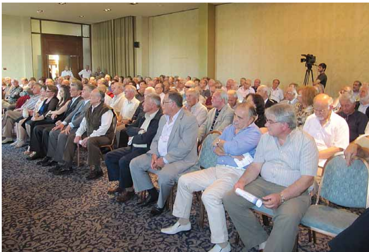
Όλοι οι ομιλητές εξέφρασαν την ικανοποίησή τους για την ανάπτυξη Τοπικών Επιτροπών