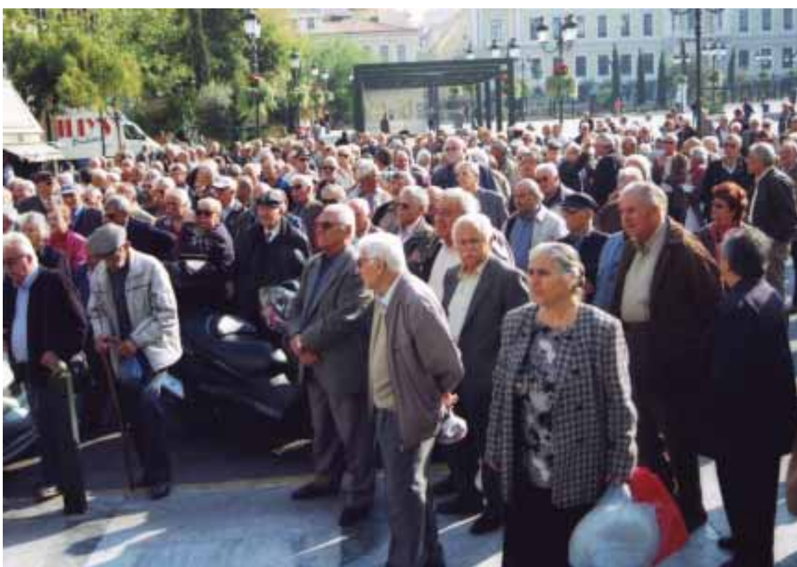
Συγκεντρώσεις - πορείες διαμαρτυρίας είναι σε καθημερινή βάση ο αγώνας των συν/ων για το νέο μεσαίωνα διαβίωσης που έστρωσε η κυβέρνηση με την ΕΕ και το ΔΝΤ

α) μειώθηκαν συντάξεις, δώρα, μισθοί και επιδόματα εργαζομένων, αλλά και οι ελάχιστοι μισθοί των νεοπροσλαμβανόμενων. Στο σκεπτικό αναφέρεται ότι τα μέτρα αυτά λαμβάνονται για τη «δίκαιη κατανομή του κόστους προσαρμογής» και προωθούνται «στο πνεύμα της διατήρησης της κοινωνικής συνοχής για να προστατευθούν οι χαμηλόμισθοι» β) αυξήθηκε ο φόρος προστιθέμενης αξίας και άλλοι ειδικοί φόροι κατανάλωσης σε κατηγορίες προϊόντων «όπου η αποτελεσματικότητα του φοροεισπρακτικού μηχανισμού είναι χαμηλή»