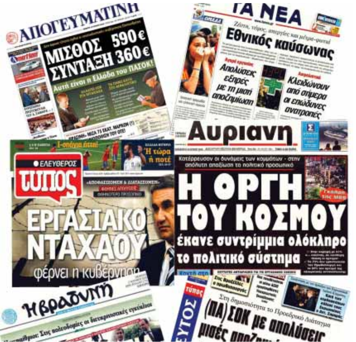
Σύσσωμος ο Αθηναϊκός τύπος εκφράζει τη λαϊκή οργή εργαζόμενων και συν/χων για την κατεδάφιση του ασφαλιστικού μας συστήματος